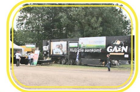
GAIN truck bij Opwekkingsconferentie

GAIN heeft in 2010 een omzet behaald van € 1,6 miljoen aan goederen en giften. Daarvan is 93 procent direct ten goede gekomen aan de behoeftige medemens. 7 procent is gebruikt voor de huur van gebouwen en brandstof voor de vrachtauto's.